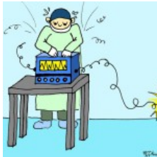
Operazione ad alto rischio...

Errori preventivi sono comuni per tutto ciò che concerne la cura della salute, qui ci occupiamo di dispositivi medici.